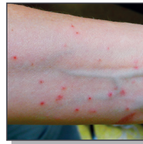
Piqûres de punaises de lits