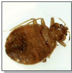
6 mm Punaise de lit adulte