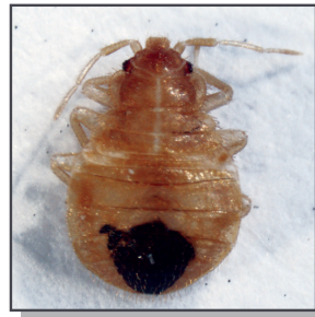
Jeune punaise de lit

Les démangeaisons causées par ces piqûres peuvent être importantes.