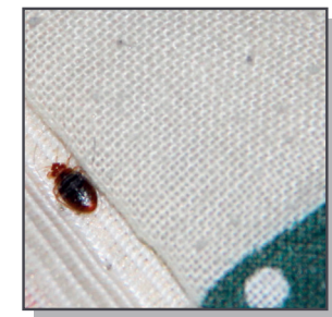
Punaise adulte sur matelas

Par exemple, si seul le bras gauche est piqué, il faut rechercher leur présence de préférence sur le côté du lit correspondant.